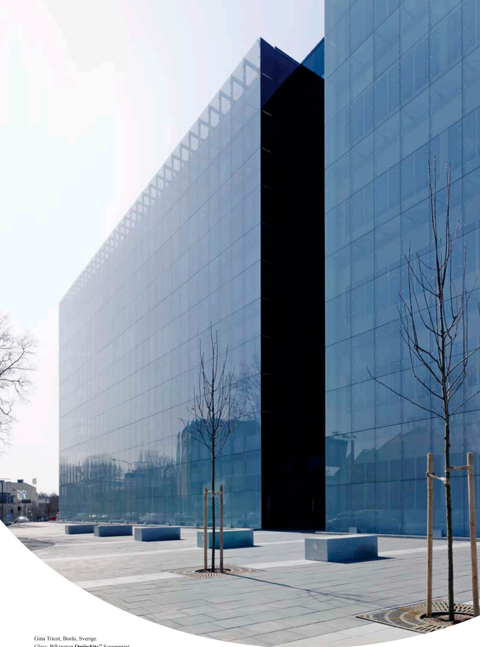
Gina Tricot, Borås, Sverige. Glass: Pilkington Optiwhite™ Screenprint